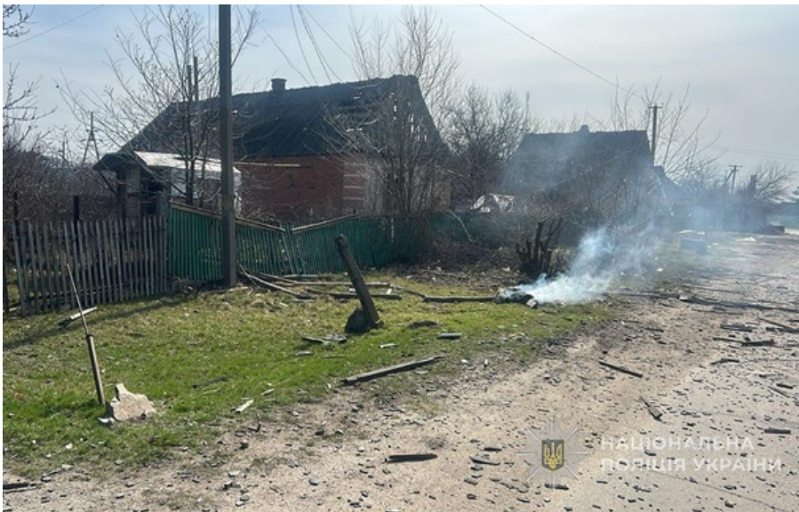
Последствия российского обстрела на Запорожье

Войска РФ нанесли удары по населенным пунктам Запорожской области. Погибли трое человек, еще трое пострадали.