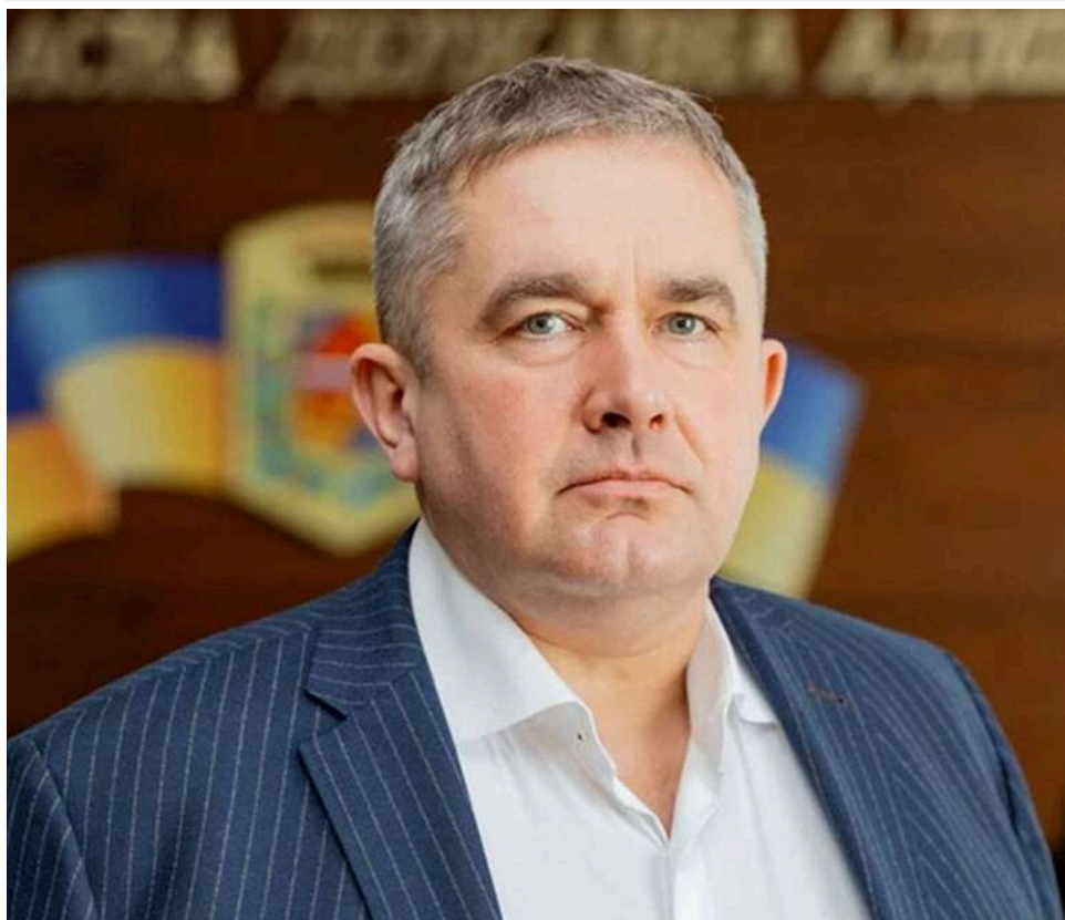
Тендери для "своїх" і шлейф кримінальних справ: що стоїть за призначенням Олега Мізіка в Полтавську ОВА