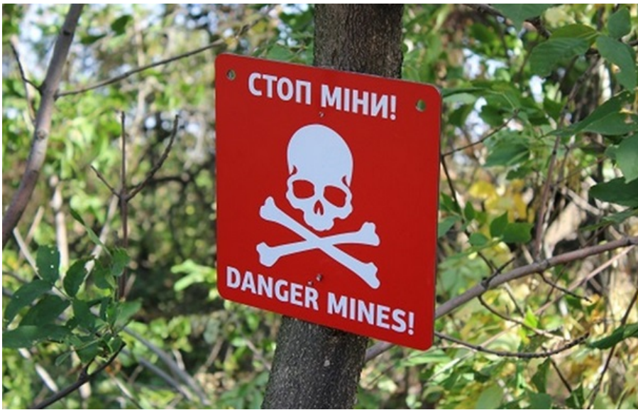
(ілюстративне фото) На прикордонні Сумщини багато російської вибухівки

17-річний хлопець, раніше евакуйований з цього села, приїхав туди на Великдень. Їхав на мотоциклі і наткнувся на вибуховий пристрій.