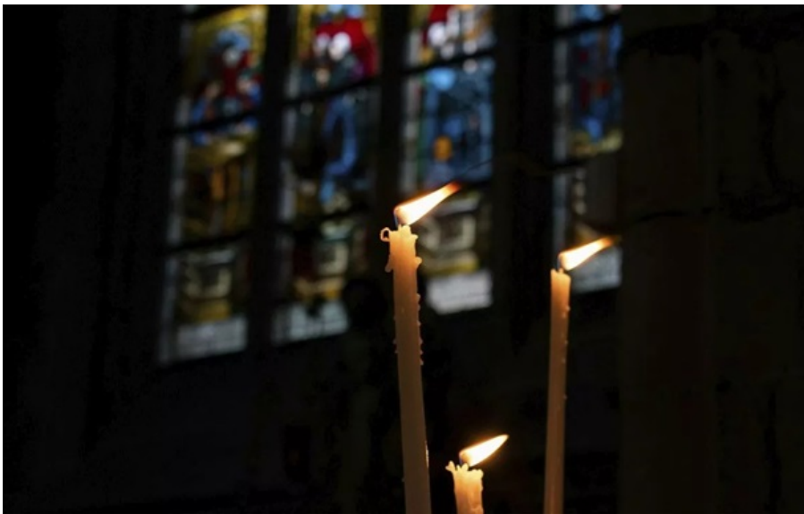
Зійшов Благодатний вогонь

Цього року церемонія сходження Благодатного вогню відбувалася у закритому режимі – з міркувань безпеки.