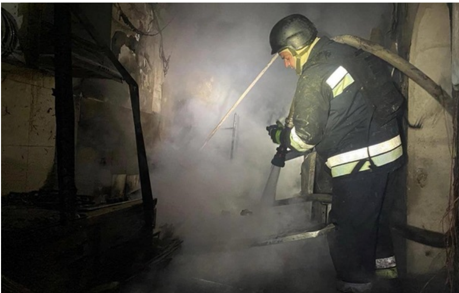
Фото: ДСНС Запоріжжя (ілюстративне фото)

По предварительной информации, в результате обстрела никто не пострадал