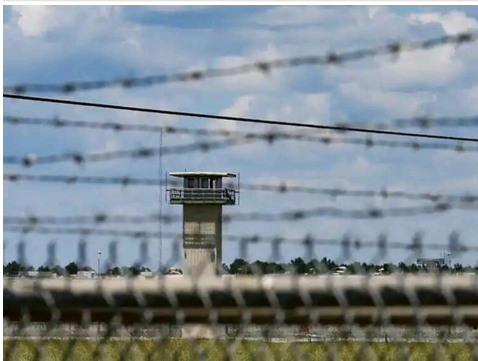
Адміністрація Трампа повертає смертну кару на федеральний рівень і розширює перелік методів її виконання

Міністерство юстиції США планує розширити список способів виконання смертних вироків, зокрема додавши можливість розстрілу.