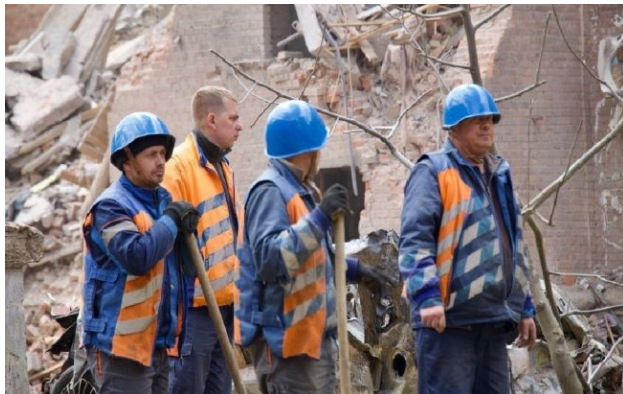
Фото: окупанти цілеспрямовано били по житлових кварталах Дніпра

Дніпро зазнало масованої атаки російських військ, яка тривала понад 20 годин. Окупанти цілеспрямовано били по житлових кварталах міста ракетами та безпілотниками.