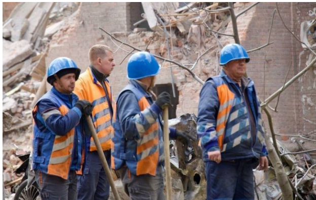
Фото: окупанти цілеспрямовано били по житлових кварталах Дніпра ( t.me/dnipropetrovskaODA )

Дніпро зазнало масованої атаки російських військ, яка тривала понад 20 годин. Окупанти цілеспрямовано били по житлових кварталах міста ракетами та безпілотниками.