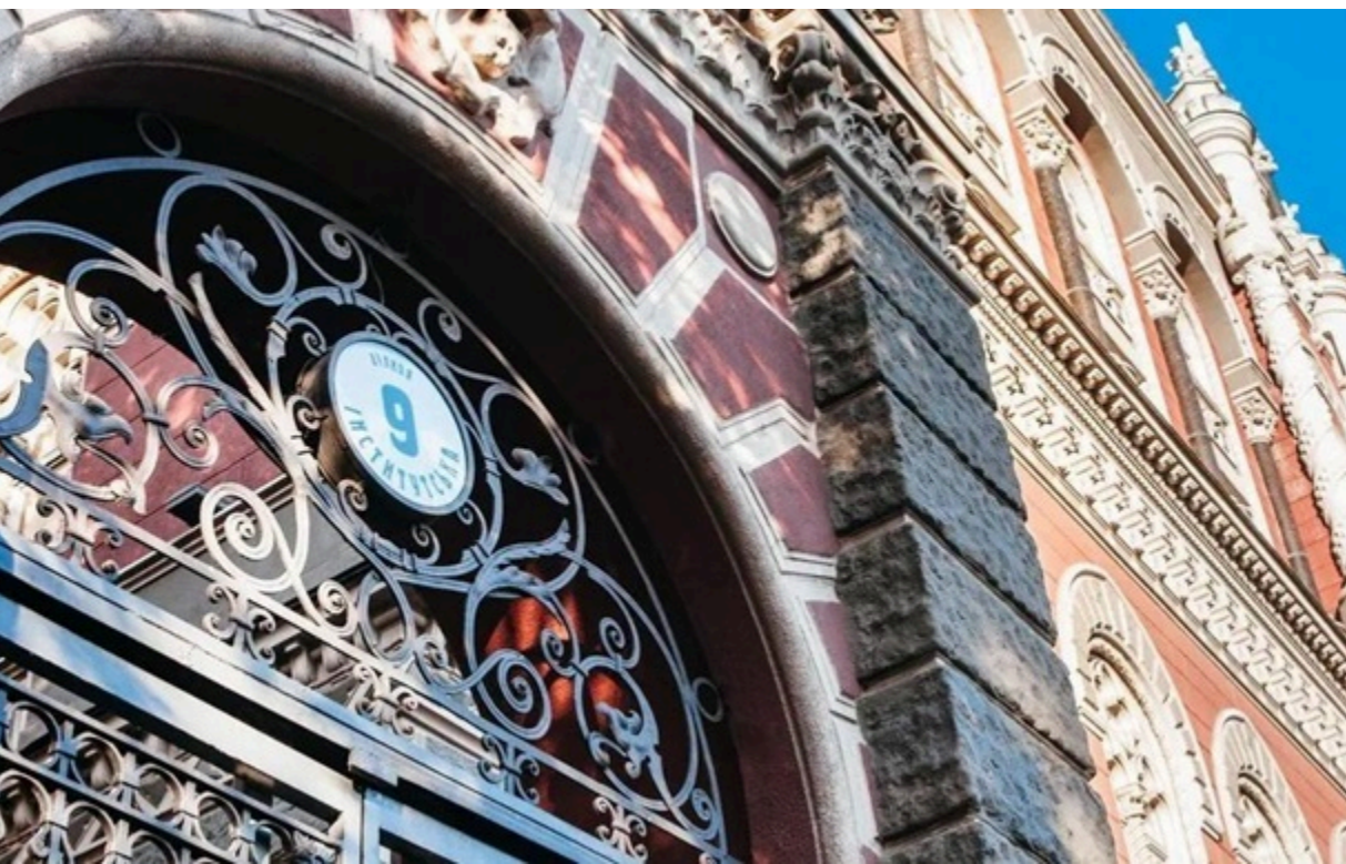
Міжнародні резерви України за місяць зменшилися на 7,3%

Обсяг резервів залишається достатнім для збереження стійкості валютного ринку, запевнили у Нацбанку.