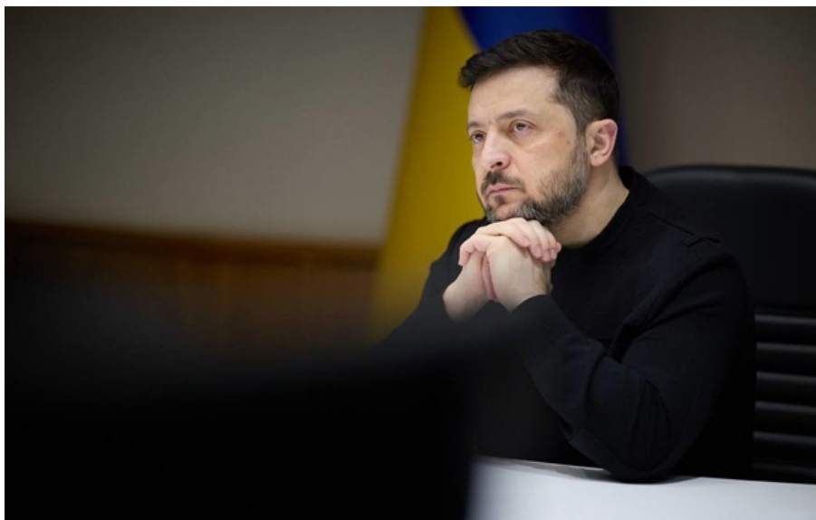
Володимир Зеленський хотів би продовжити перемир'я

Відсутність російських ударів у небі, на землі та на морі означатиме відсутність відповідей України, запевнив президент.