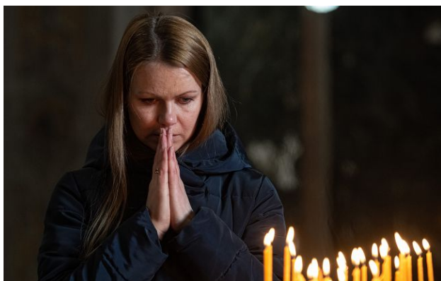
Поминальні дні - важливі для кожного українця

Обирайте перевірене - додайте РБК-Україна до улюблених джерел у Google