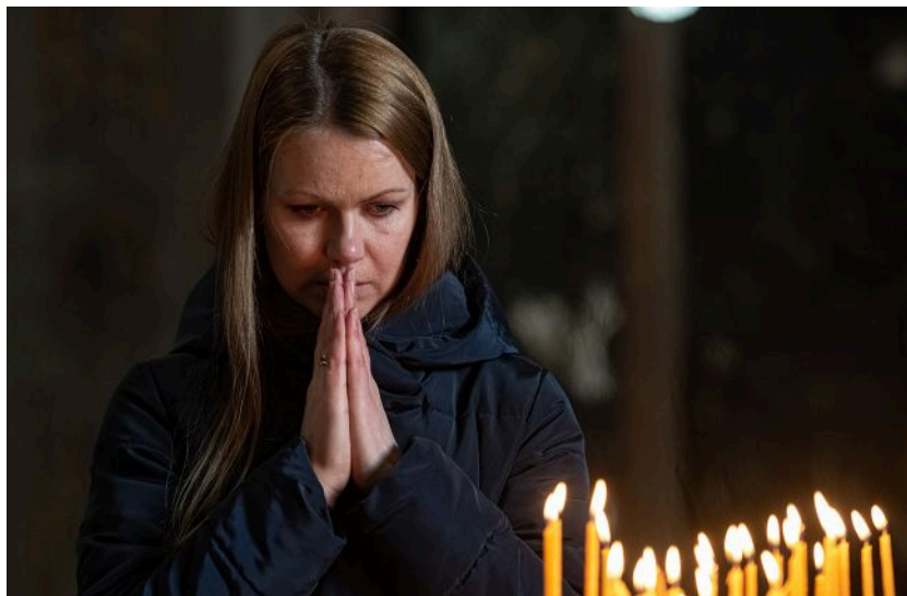
Поминальні дні - важливі для кожного українця