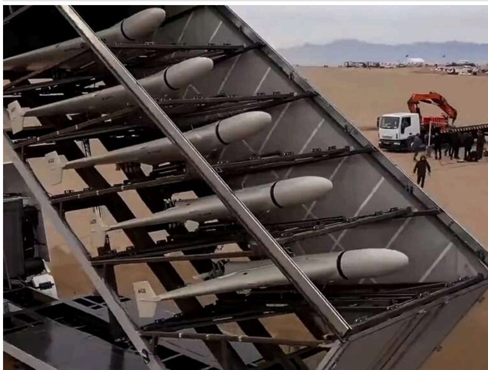
Новий полігон для «шахедів»: окупанти розбудовують капітальну базу в Орловській області

Російські окупанти зводять новий майданчик для запуску дронів-камікадзе типу Shahed . Об'єкт знаходиться поблизу села Цимбулова, приблизно за 170 км від українсько-російського кордону.