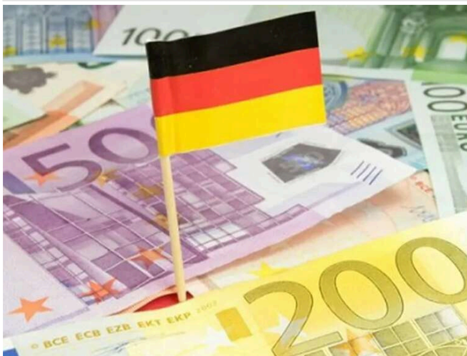
Війна та енергокриза: бюджет Німеччини недоотримає понад 50 мільярдів євро податків до 2030 року

Німеччина очікує бюджетний дефіцит у десятки мільярдів євро через подорожчання енергоносіїв, повідомляє Bloomberg.