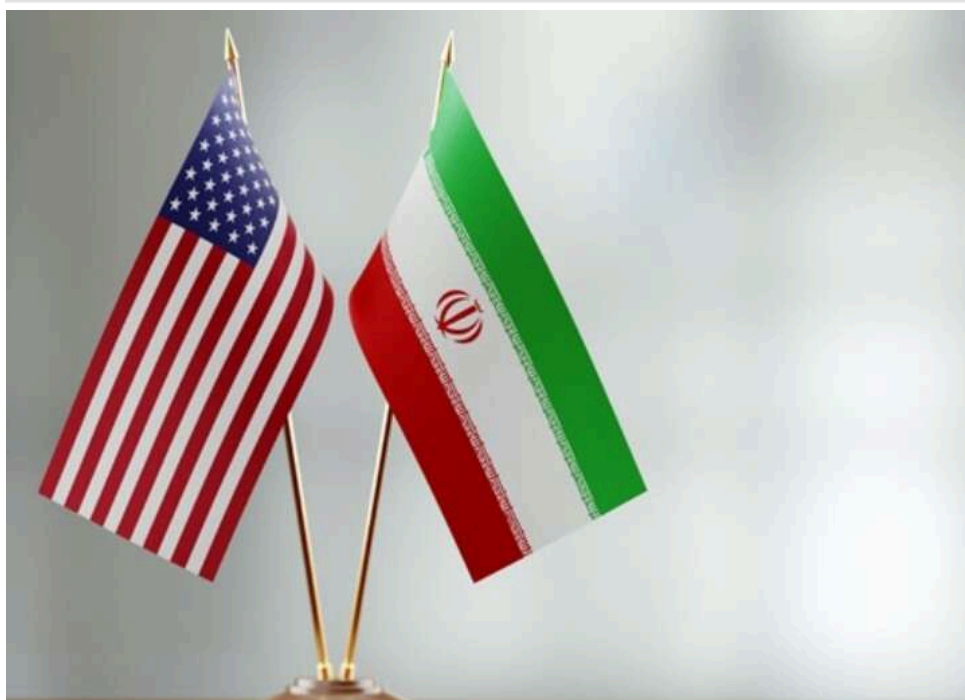
Іран привіз до Ісламабада делегацію з 71 особи для переговорів зі США