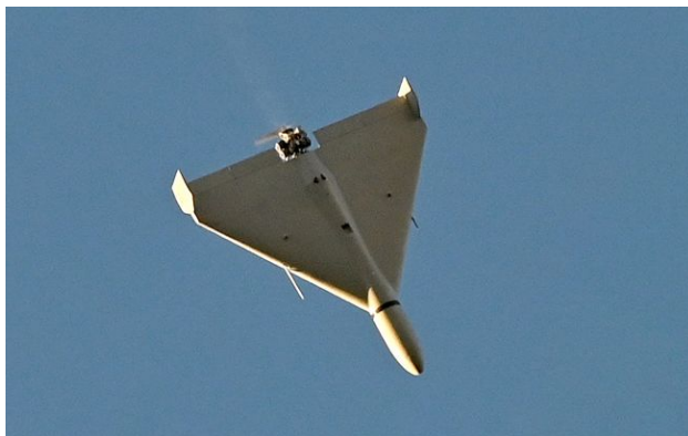
Фото: у Дніпрі "Шахед" залетів прямо у вікно квартири

У Дніпрі триває ліквідація наслідків масованої атаки російськими ракетами та дронами, внаслідок якої загинули п'ятеро людей та понад 40 дістали поранення.