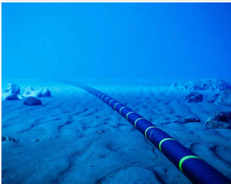
Загроза глобального блекауту: Іран натякнув на можливість пошкодження інтернет-кабелів в Ормузькій протоці

Іран здатен перерізати підводні інтернет-кабелі в Ормузькій протоці, позбавивши країни Перської затоки доступу до мережі.