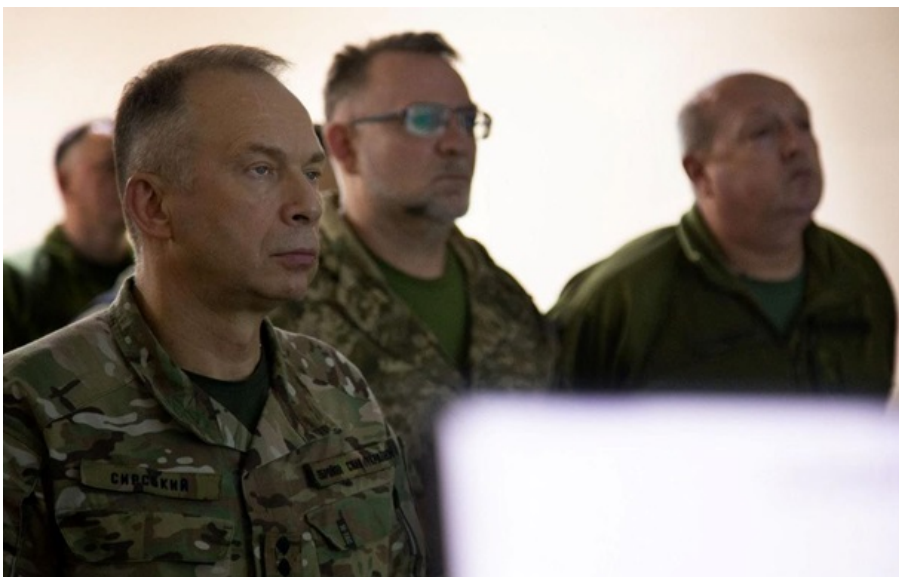
Олександр Сирський відвідав Південну операційну зону

Головком віддав необхідні розпорядження для кращого забезпечення підрозділів боєприпасами, дронами та іншими матеріально-технічними засобами.