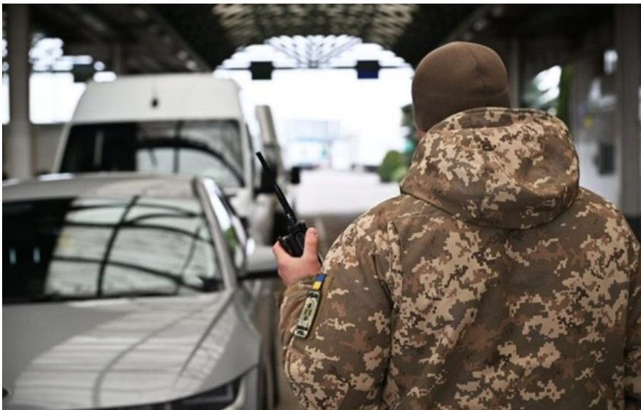
На Львівщині зафіксовано накопичення транспорту на в'їзд в Україну

Прикордонники рекомендують врахувати поточну ситуацію під час планування поїздки та обирати менш завантажені пункти пропуску.