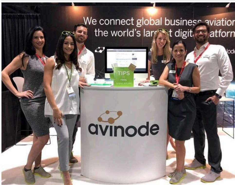
Кіпр, ОАЕ та Туреччина: як авіаброкери використовують шведський сервіс Avinode для обходу санкцій проти РФ

Євросоюз вимагає розслідування: шведську компанію Avinode запідозрили в сприянні російській еліті в обході санкцій.