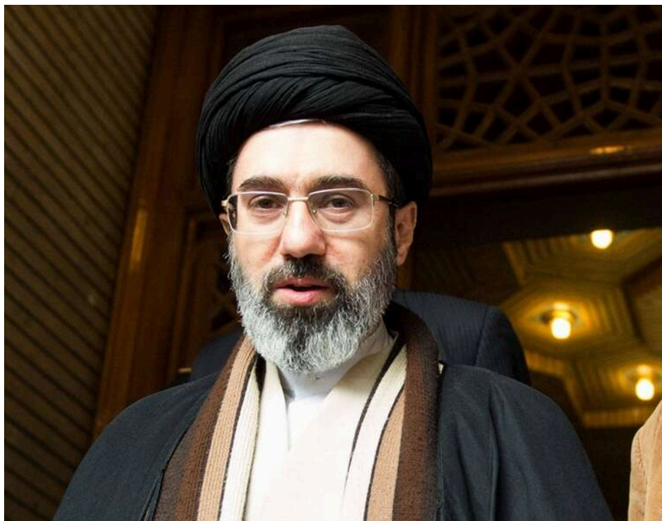
Жахливі наслідки атаки на Тегеран: Reuters дізналося про спотворене обличчя та ампутацію в лідера Ірану

Стан нового верховного лідера Ірану Моджтаби Хаменеї може бути значно гіршим, ніж вважалося. Він зазнав тяжких поранень і досі обмежено бере участь в управлінні країною.