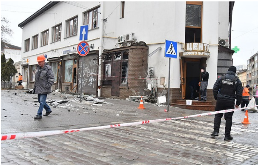
СБУ сообщила подробности дела

В рамках дела о подрыве фигурируют две женщины, одной из которых обещали 2 тысячи гривен за выполнение определённых заданий.