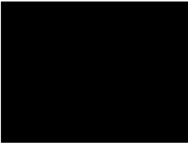
Фото: НПЗ в Новокуйбишевську після атаки безпілотників