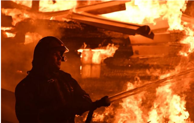
Фото: дим від НПЗ видно в усьому місті, пишуть очевидці (росЗМІ)

У Самарській області Росії вранці 18 квітня безпілотники атакували нафтопереробний завод у місті Новокуйбишевськ.