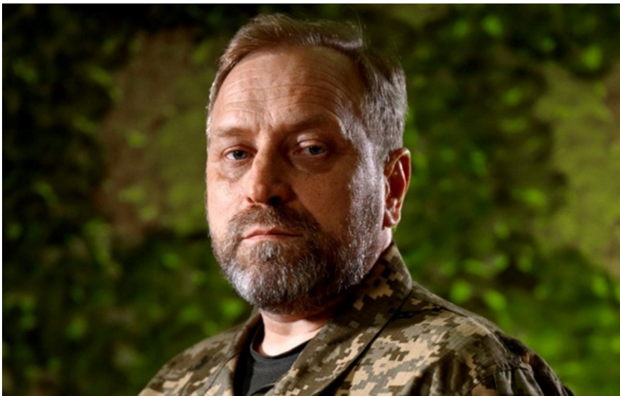
Бригадний генерал Сергій Сірченко втратив посаду командира 11 корпусу

Вже після свого звільнення Сергій Сірченко визнав, що він "мовчав, коли треба було говорити".