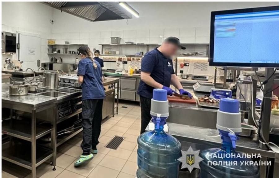
Полицейские расследуют нарушение санитарных норм в детском развлекательном центре Львова

В городской больнице госпитализировали десятки человек с жалобами на тошноту, многократную рвоту, боль в животе и диарею.