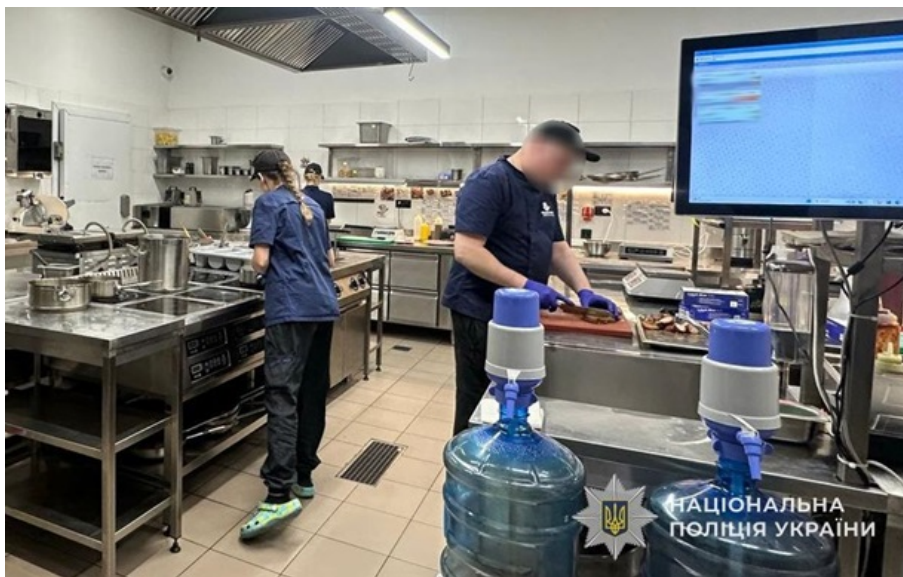
Полицейские расследуют нарушение санитарных норм в детском развлекательном центре Львова

👍 0 👍 0 ЧИТАТЬ НОВОСТЬ НА УКРАИНСКОМ 👁 95