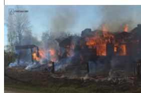
Зеленський відповів на нові масовані атаки РФ Вчора, 13:35