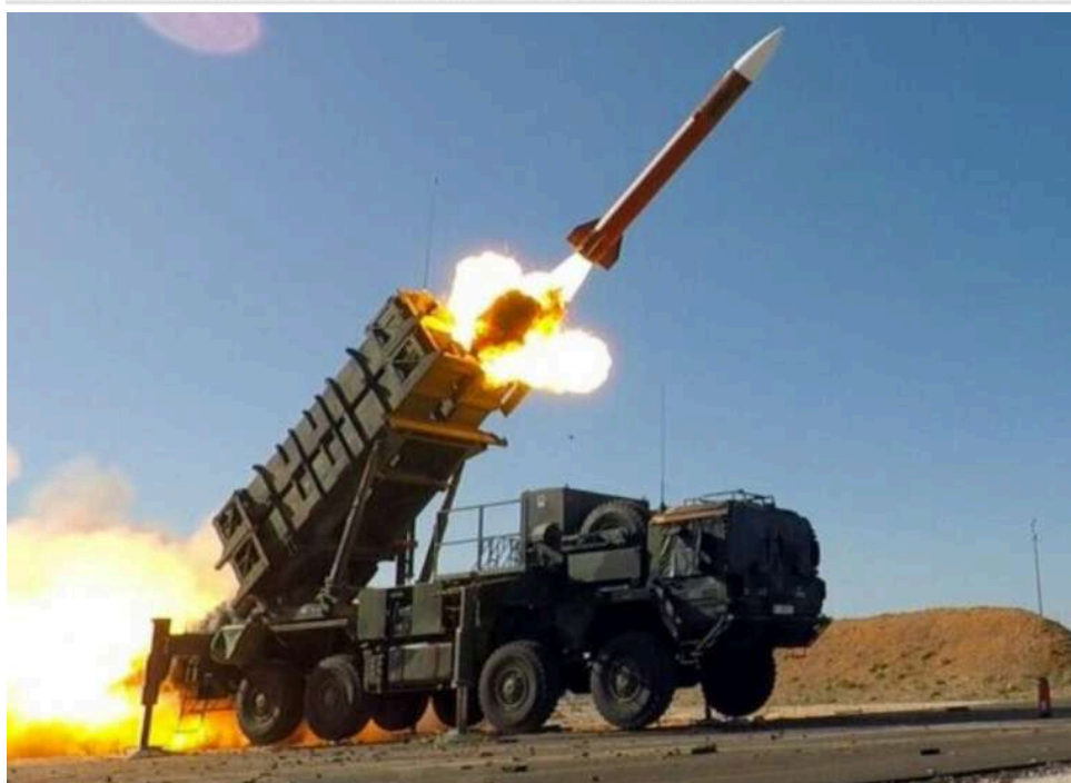
Рекордні 4,7 мільярда доларів на захист неба: Пентагон замовляє масове виробництво перехоплювачів Patriot у Lockheed Martin

Пентагон уклав з компанією Lockheed Martin рекордний контракт на суму 4,7 млрд доларів на прискорене виробництво ракет-перехоплювачів для систем ППО Patriot.