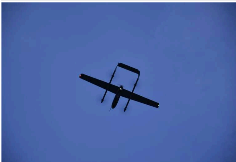
Дрони знову атакували нафтопровідну станцію «Кримська» на Кубані: виникла пожежа

У ніч проти 11 квітня невідомі дрони відвідали лінійну виробничо-диспетчерську станцію "Кримська" на Кубані. Вона є важливою частиною нафтопровідної системи "Транснефти" і днями вже зазнавала атаки.