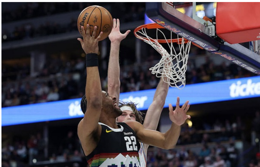
Фото: Getty Images НБА

Пропонуємо вам ознайомитися з детальними результатами та аналітичними оглядами останніх матчів Національної баскетбольної асоціації.