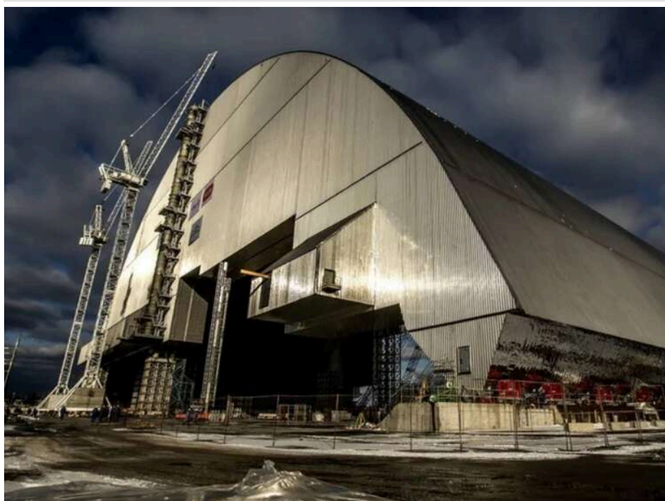
Ремонт конфайнменту на ЧАЕС після атаки дронів коштуватиме 500 мільйонів євро і триватиме до 2030 року

Роботи з відновлення Нового безпечного конфайнменту на Чорнобильській атомній електростанції після атаки дрона можуть тривати до 2030 року. Причина - захмарна вартість робіт: фінансування може скласти близько пів мільярда євро. Власне, цей термін є своєрідним дедлайном - після цієї дати конструкція почне кородувати.