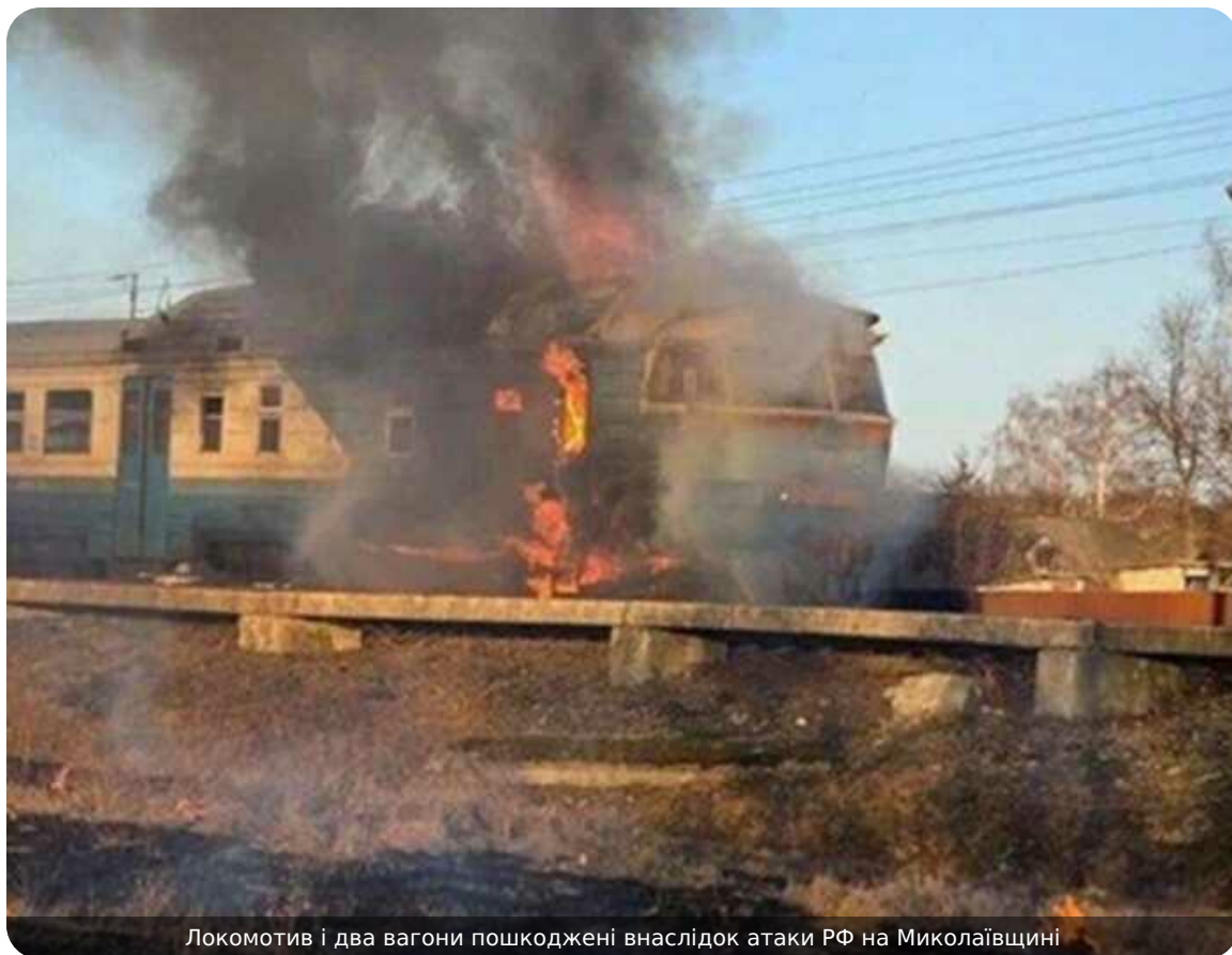
Локомотив і два вагони пошкоджені внаслідок атаки РФ на Миколаївщині

В "Укрзалізниці" повідомили про нову атаку на пасажирський рухомий склад у Миколаївській області. Унаслідок удару було пошкоджено локомотив і два вагони, проте пасажирів та співробітників залізниці не постраждали.