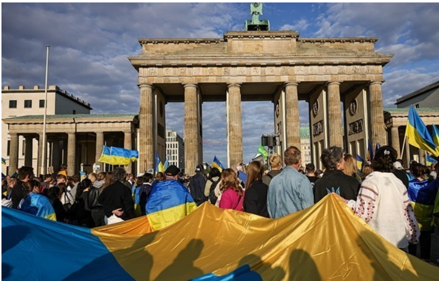
Українські біженці

Йдеться про облік вразливих категорій населення, це необхідно для планування політики повернення та підготовки громад до прийому людей.