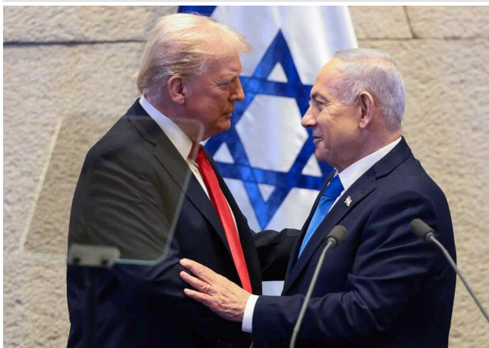
США закликали Ізраїль призупинити удари по Лівану перед переговорами, - Axios

США попросили Ізраїль призупинити удари по Лівану перед початком прямих переговорів.