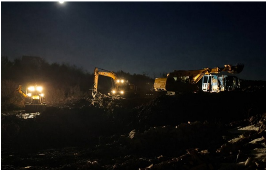
На месте работают аварийные бригады

Город обратился в правоохранительные органы по факту повреждения критической инфраструктуры частной техникой.