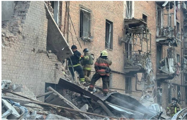
Фото: у Дніпрі внаслідок удару РФ є загиблі

Внаслідок російського удару по багатоповерхівці у Дніпрі вночі 25 квітня є загиблі. Під завалами ще можуть перебувати люди.