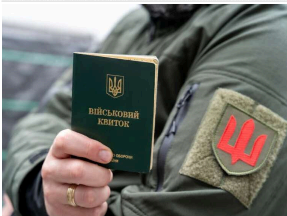
Штраф ТЦК на 25 500 гривень скасовано: Апеляційний суд вказав на порушення процедури виклику та неправильну кваліфікацію

Шостий апеляційний адміністративний суд скасував постанову ТЦК про накладення штрафу 25 500 грн на військовозобов'язаного. Суд дійшов висновку, що орган не довів подію і склад адміністративного правопорушення, не підтвердив дотримання процедури направлення на військово-лікарську комісію, а також застосував неправильну норму КУпАП. Провадження в справі закрито.