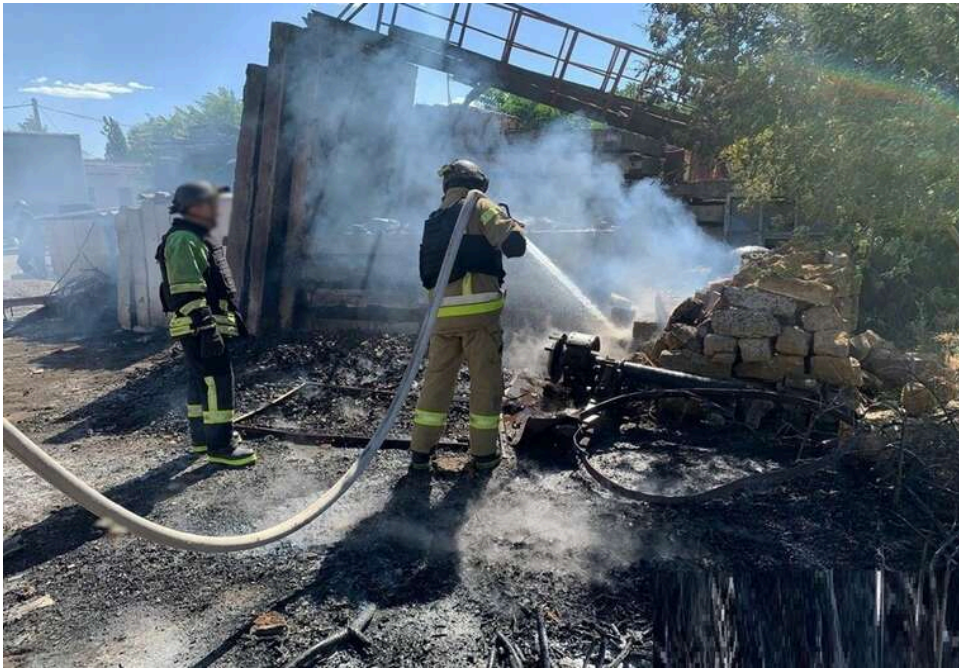
У Дніпрі з-під завалів дістали двох загиблих: під руїнами можуть залишатися люди

У Дніпрі з-під завалів дістали тіла двох загиблих: під руїнами можуть бути ще люди.