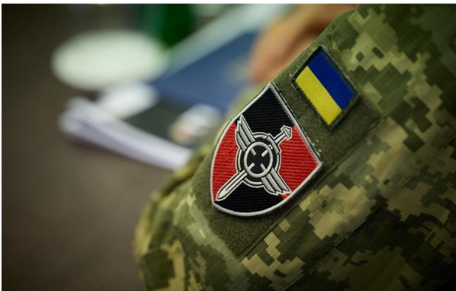
На Близькому Сході понад 200 фахівців української ППО

Російська пропаганда з посиланням на італійське медіа поширила фейк про те, що нібито "шейхи попросили поїхати геть українських фахівців ППО".