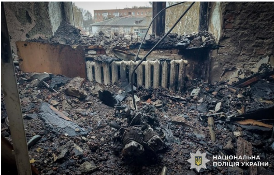
Наслідки російської атаки в Сумах

У Сумах "шахеда" пошкодили 12 багатоквартирних та один приватний житловий будинок, дитячий садок, 10 автомобілів.