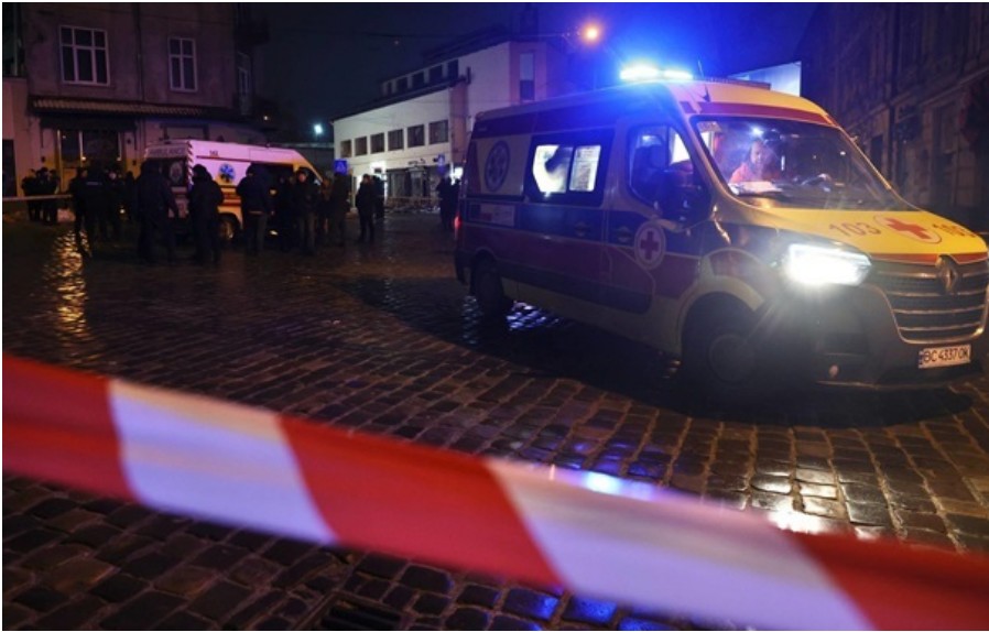
Взрывы во Львове произошли в ночь на 22 февраля