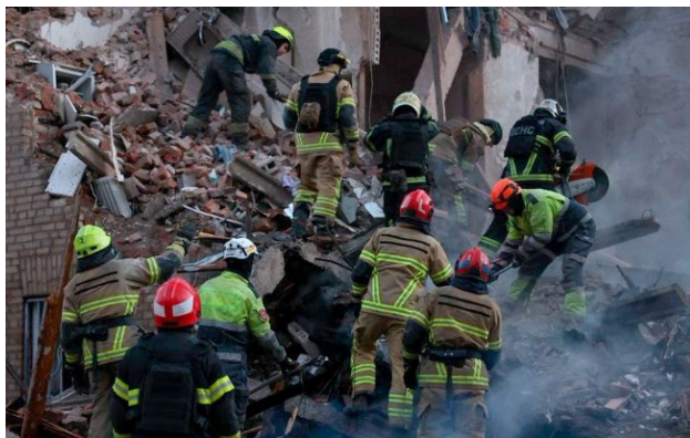
Фото: наслідки обстрілу Дніпра 25 квітня

У ніч на 25 квітня російські окупанти завдали серії ударів по Харкову, Дніпру, Сумській, Київській та Запорізькій області.