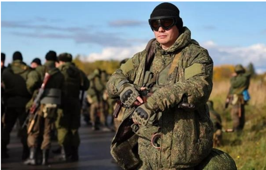
Фото: РИА Новости (ілюстративне фото) Кремль збирається заселити ТОТ Херсонщини військовими

Право на землю пропонується надати військовослужбовцям, добровольцям, співробітникам силових структур, які брали участь у бойових діях, а також сім'ям загиблих.