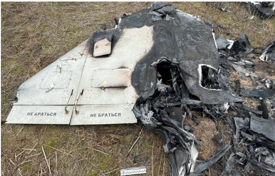
БПЛА атакував Полтавщину

Ворожий безпілотник пошкодив приміщення магазину та кав'ярні. Одна людина загинула, одна отримала поранення.