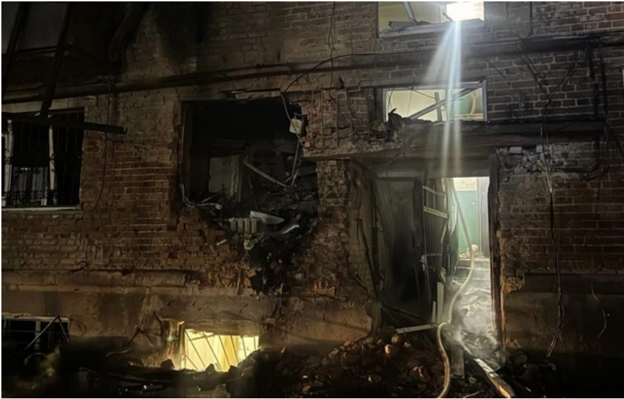
Наслідки атаки

Росіяни цілеспрямовано б'ють по домівках людей у житлових районах. Більшість постраждалих – люди літнього віку.