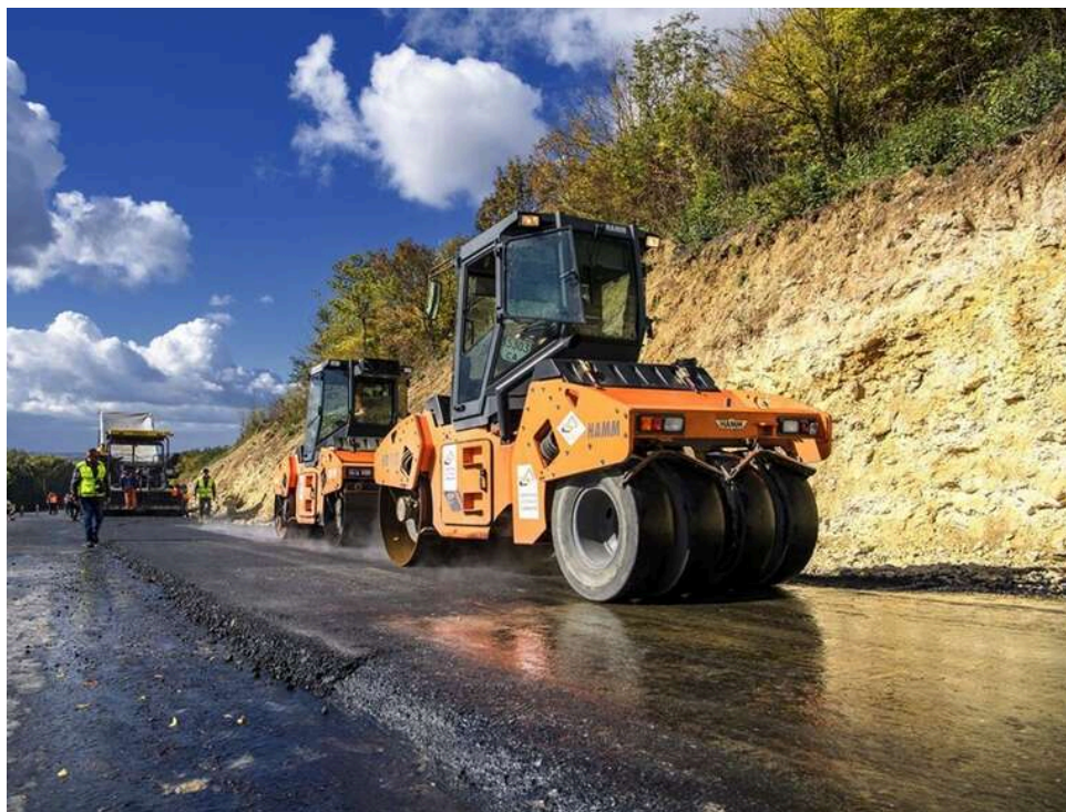
Кіровоградське кумівство на полтавських дорогах: як Калінін, Деружинський і Зорькін монополізували бюджетні потоки

У Полтавській області сформована управлінська зв'язка, яка отримала контроль над ключовими бюджетними потоками – дорожнє будівництво та комунальна інфраструктура. Це мільярди гривень, що розподіляються через обмежене коло людей, пов'язаних між собою не конкурсами та професійною репутацією, а спільною історією роботи та особистими зобов'язаннями.