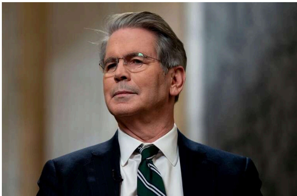
Цифрова бомба для Уолл-стріт: Мінфін США збирає банкірів через суперпотужний ШІ від Anthropic

Міністр фінансів США провів термінове засідання з лідерами найбільших банків щодо ризиків нової моделі ШІ від Anthropic.