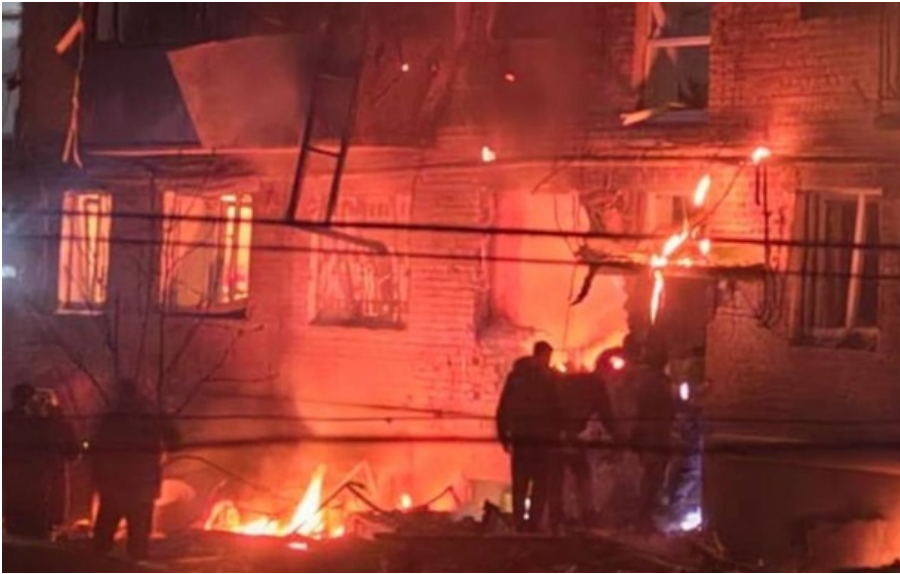
Наслідки атаки у Сумах

Росіяни увечері пошкодили щонайменше дві п'ятиповерхівки у місті. Виникла пожежа. За попередніми даними, є постраждалі.