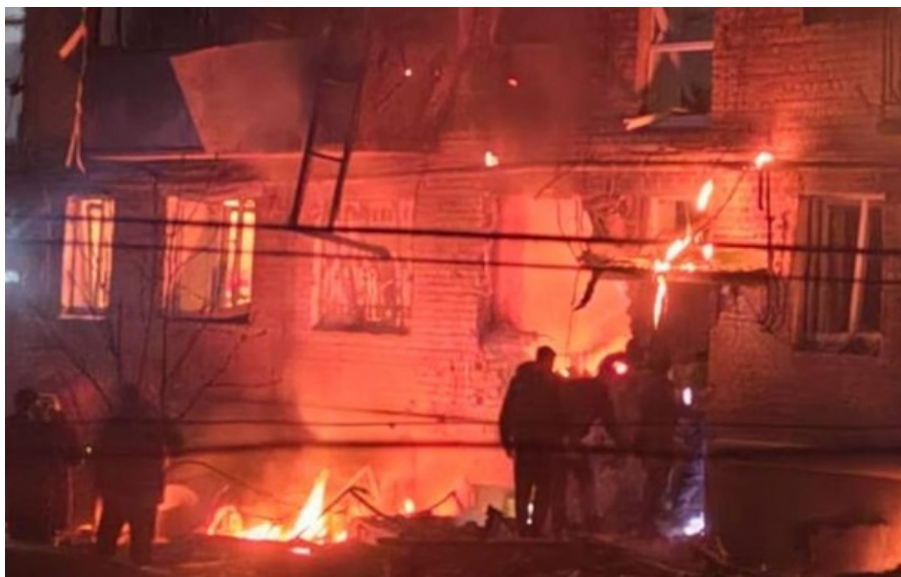
Наслідки атаки у Сумах

Росіяни увечері пошкодили щонайменше дві п'ятиповерхівки у місті. Виникла пожежа. За попередніми даними, є постраждалі.