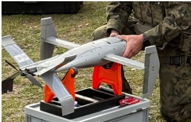
Фото: дрон-перехоплювач системи Merops (DVIDS)

Румунія екстрено посилює захист своїх кордонів на тлі війни в Україні. На базі біля Чорного моря завершилися випробування новітніх безпілотників-перехоплювачів системи Merops.